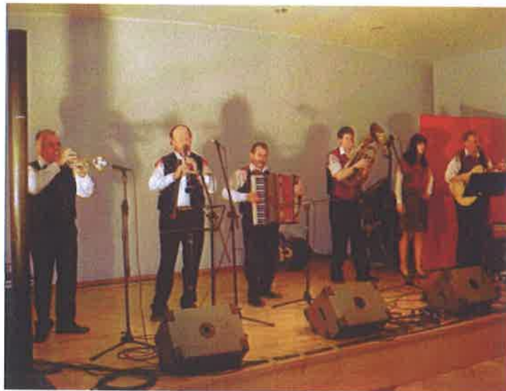
Oberkraiener Quintett Gruden