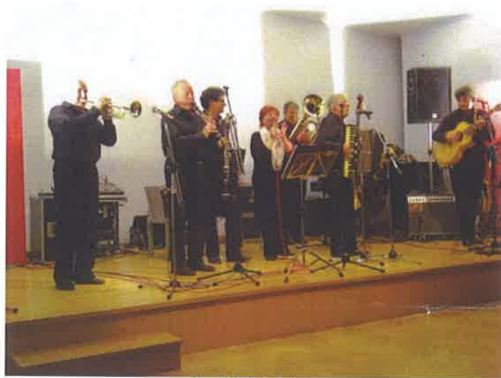
Vier Schmiede Quintett