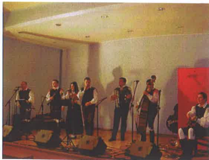
Oberkraiener aus Begunje