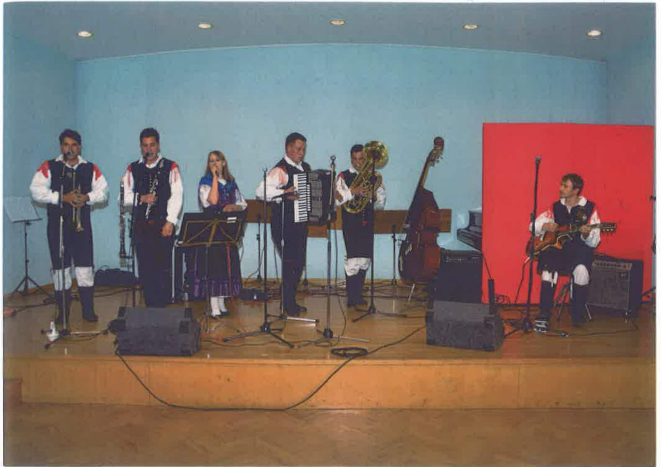
Oberkrainer Quintett Avbreht