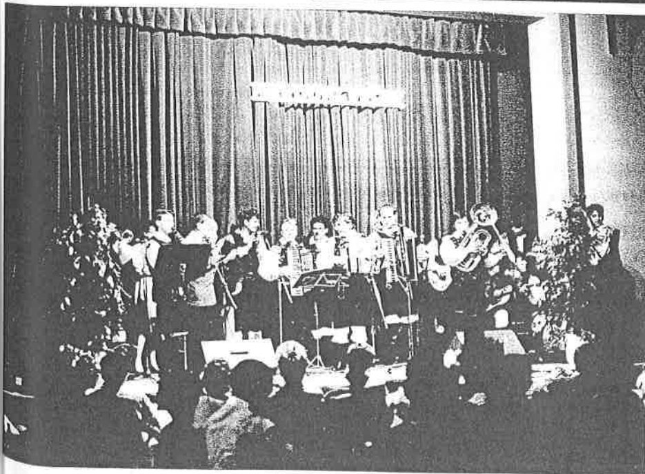
national music evenings, and the so called National Day performances.