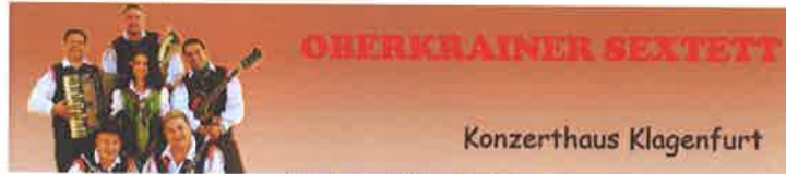
Oberkrainer Klänge Sextett